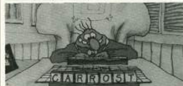
Een grieke tragedie - The big snit