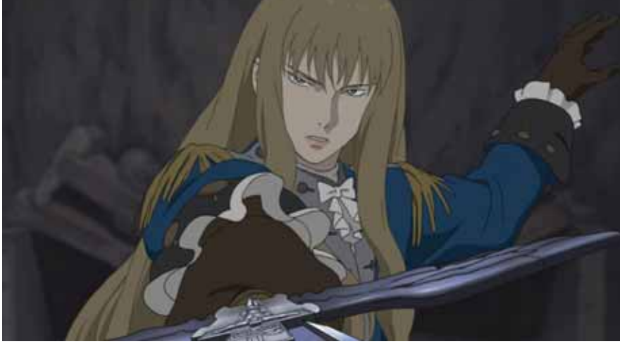
Le Chevalier d'Eon © Kaze