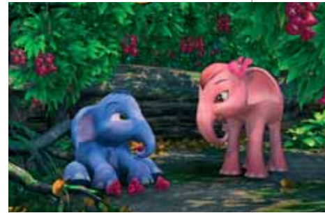
Khan Kluay

Khan Kluay , de eerste computer-animatiefilm uit Thailand, is geïnspireerd op een oude (en diepgewortelde) legende over de eeuwenoude banden tussen de mens en dit nobele dier.