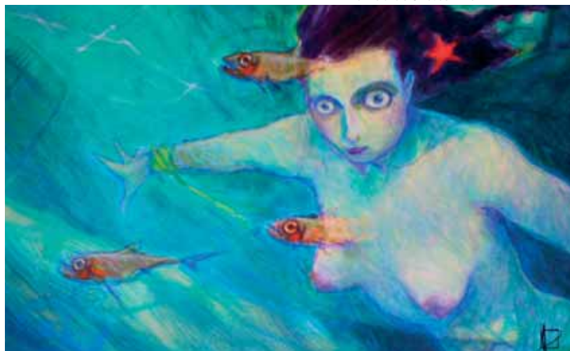
De Profundis

En présence de Miguelanxo Prado (sous réserve).