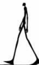
Weiss © Kunsthochschule Kassel

03/02 - 21:30 Studio 5 (V. angl. / Eng. V.)