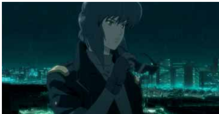
Kokaku Kidotai

J apon 2034: mensen en robots zijn verbonden aan een interactief centraal netwerk. De gereputeerde sectie 9, die instaat voor de nationale veiligheid, krijgt te maken met een nieuw geval van cyberterrorisme. Het brein daar achter is de "poppenspeler", die geducht is omdat hij in staat is cyberhersenen te "hacken".