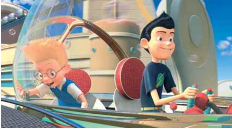
Meet the Robinsons