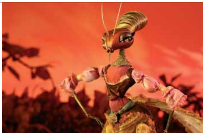
Le Cid

L e Cid van Corneille is een werk dat al eeuwen staat als een huis en wordt beschouwd als een van de belangrijkste theaterstukken ooit. Hoe moet je dat dan in godsnaam afstoffen en wat nieuw leven in blazen?