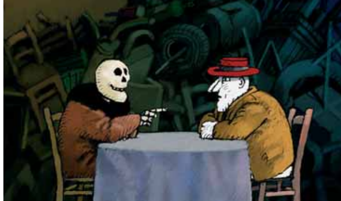
Le Tueur de Montmartre

En seriemoordenaar houdt lelijk huis in Montmartre. Bij wijze van bekentenis neemt hij ons mee naar de meanders van zijn gedraaide en gemartelde geest. De zwartgallige humor is dan ook alomtegenwoordig in deze vlijmscherpe beschrijving van een individu dat worstelt met zijn eigen kwelduivels. De moordenaar wordt alsmaar gewelddadiger. De spanning neemt stilaan toe, maar op een dag leert hij toch nog wat verliezen is. Ondertussen heeft hij wel de buik van een handvol Parijzenaars opengereten.