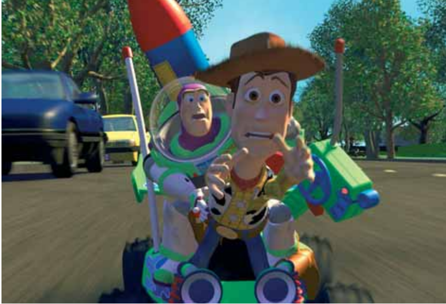
Toy Story

Connu depuis «Toy Story 1» comme LE studio 3D à la fois le plus créatif et le plus performant au monde, Pixar aussi a commencé petit.