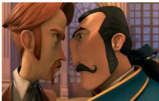
A Gentleman's Duel © Blur Studio