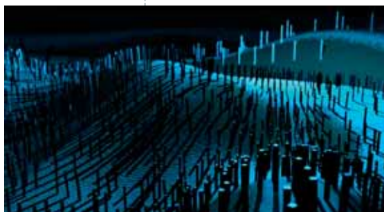
Shades of blue © Spilliaert/ KASK