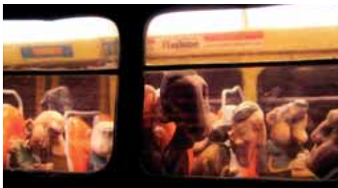
Séquence 1 Plan 2 © Adifac