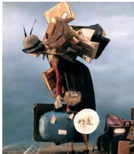
MadameTutli Putli