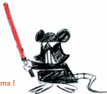
Une petite histoire de l'image animée © Mikros Image

In een dip ? Een beetje depri ? Last van vitaminetekort ? Draait de wereld niet zoals je zou willen ? Allemaal niet erg... Negen dagen lang is er immers Anima ! Kom eens langs in Flagey tussen 1 en 9 februari Je voelt je meteen een stuk beter !