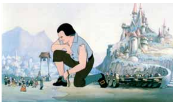
Les Voyages de Gulliver

Ce premier long métrage des studios Fleischer était destiné par la Paramount à concurrencer ceux de Disney.