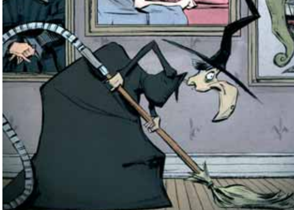
Isabelle au bois dormant © ONF