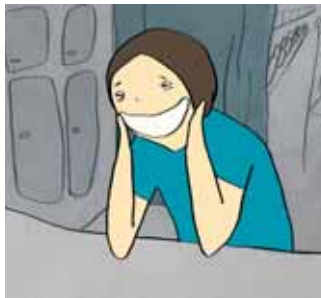
Ilo Irti © CARTOON

Grâce à cette prestigieuse récompense, le réalisateur primé peut se lancer dans des projets à plus long terme.