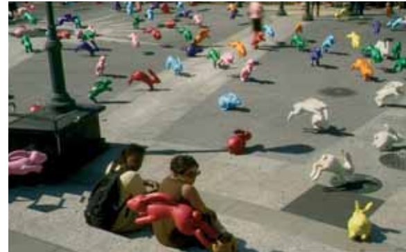
Sony Bravia 'Play-Doh'