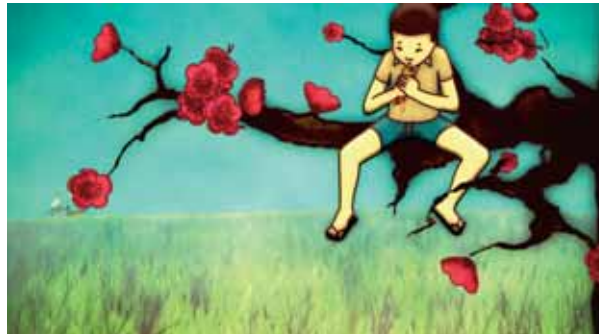
Bonsoir M. Chu © Je suis bien content