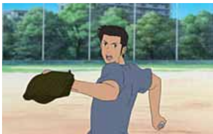
Toki o Kakeru Shôjo