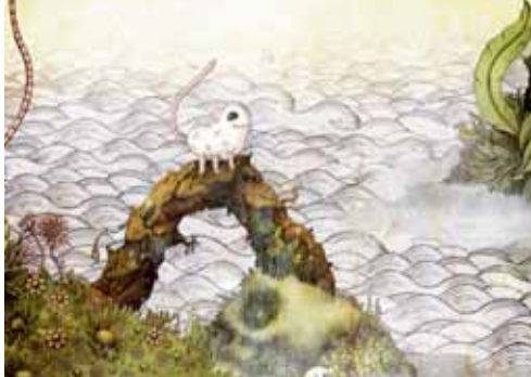
The Tale of How © Autour de minuit