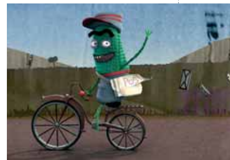
The Red Suitcase © Saul Freed