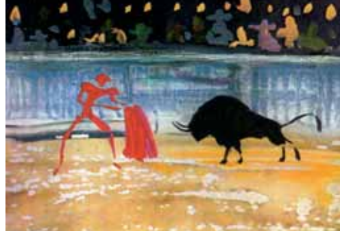
Czerwone i Czarne