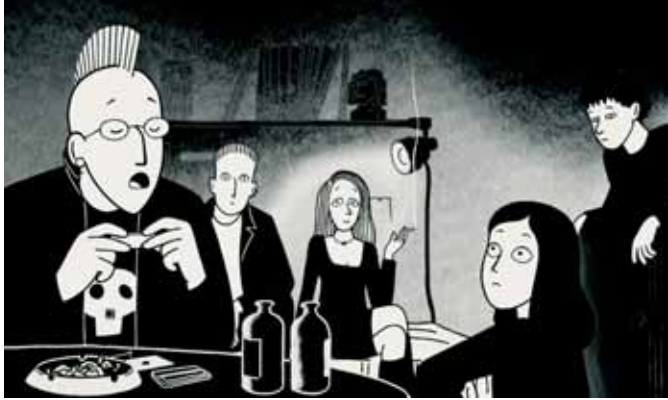
Persepolis