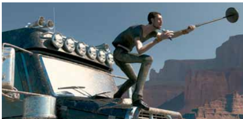
Harmonix 'Rock Band' © Passion Pictures