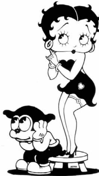
Betty Boop