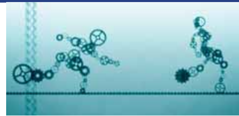
Eletvonal / Life Line © CARTOON

aan een korte animatiefilm geselecteerd uit de prijswinnaars van de belangrijkste Europese animatiefilmfestivals, waaronder ANIMA. Deze prijs wordt uitgereikt ter afsluiting van het Forum Cartoon, georganiseerd door CARTOON met de steun van het MEDIA programma van de Europese Commissie. Deze prestigieuze bekroning stelt de winnaar in staat projecten op langere termijn te ontwikkelen.