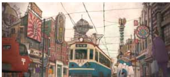
Tekkon Kinkreet

Langspeelfilm van Michael Arias, Japan, 2007, 1.51' u, O.V. driet. ond.