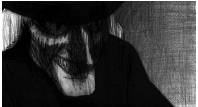
Peur(s) du noir