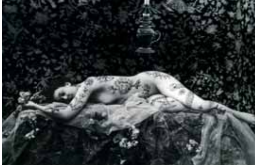
Labirynt © Cako Studio Ltd