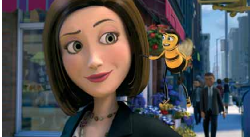
Bee Movie

Futé, Barry décide de tenter sa chance à New York. Lors de sa première sortie de la ruche, il enfreint la règle d'or des abeilles en adressant la parole à une humaine, Vanessa, une jolie fleuriste new-yorkaise. Il découvre alors avec stupeur que, depuis des siècles, les hommes font commerce de miel et volent le bien des abeilles depuis des temps immémoriaux. Scandalisé, il décide de donner un sens à sa vie et tente un procès à la race humaine.