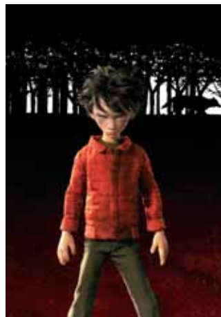
Peter and the Wolf