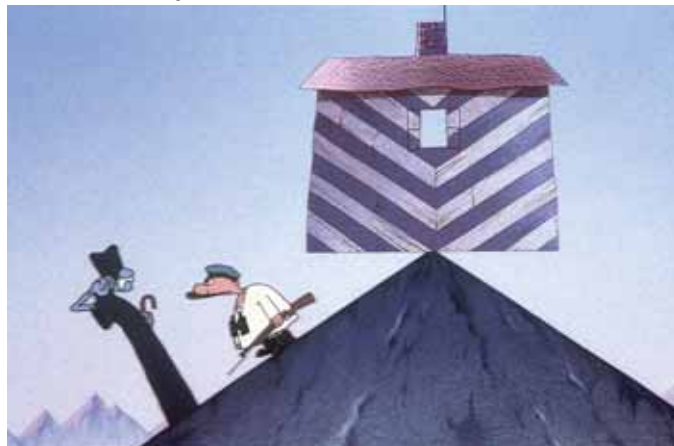
Au bout du monde