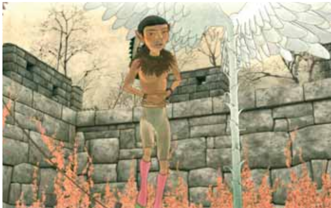
A Child Who Lost a Smile

D'Europe et d'ailleurs, ils déferlent, tous ces films qui en 7 programmes vont vous faire voyager, rire, pleurer, grincer des dents, et puis surtout vous éblouir par leur singularité. Six programmes de courts et pour la première fois un programme de clips et de pubs. Et comme chaque fois, vous pouvez voter pour l'attribution du prix du public.