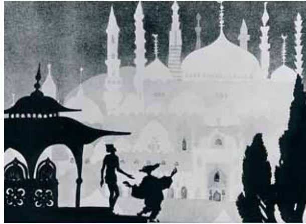
Die Abenteuer des Prinzen Achmed

Un spectacle proposé dans le cadre du festival Tintamarre, une production du Conseil de la Musique de la Communauté Wallonie-Bruxelles