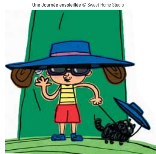
Une Journée ensoleillée © Sweet Home Studio

zorgen voor een vleugje poëzie en exotisme in deze compilatie van de beste korte animatiefilms van het jaar, die dingen naar de prijzen van de internationale competitie én naar een bekroning met de publieksprijs.