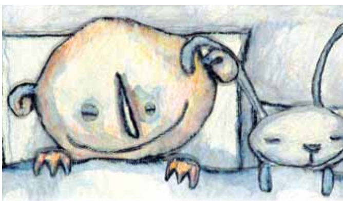
L'Enfant sans bouche

La journée d'un petit garçon à la plage en compagnie de son oncle, la course de Lola au supermarché, partie acheter de la confiture pour les crêpes et qui se perd sur le chemin du retour, la passion d'Aston pour des galets qu'il couve comme des bébés mais qui finissent par envahir la maison au grand dam de ses parents, et l'histoire d'un enfant sans bouche et son ami le lapin aux immenses oreilles. Des histoires toutes simples, de petits et grands bonheurs, et parfois de beaucoup de courage, racontées avec le talent visuel de Lotta et Uzi Geffenblad