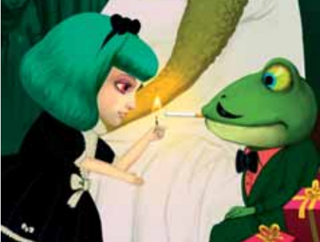
Idole aux milles reproches © Ecole Emile Cohl