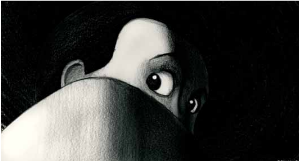
Peur(s) du noir