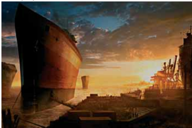
Ark © Platige Image

Terence Masson toont ons het volledige overzicht van de nieuwigheden die op Siggraph 2007 werden voorgesteld: een twee uur durend gevarieerd menu van speciale effecten, kortfilms, publiciteitsspots, onafhankelijke animatie en experimentele films.