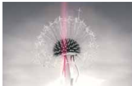
Don't Set Yourself on Fire

Het Onedotzero-festival is opnieuw van de partij met de allerlaatste en uiterst innoverende muziekvideo's.