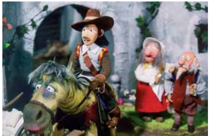
The Three Musketeers

W e bevinden ons in Frankrijk, in de 17 e eeuw. De jonge d'Artagnan verlaat zijn provincie Gascogne en trekt noordwaarts richting Parijs om er zijn geluk te beproeven bij de "compagnie des mousquetaires", de persoonlijke garde van de koning. In de hoofdstad aangekomen, stoot hij op 3 musketiers (Athos, Porthos en Aramis), die de jonge zuiderling onder hun vleugels nemen. D'Artagnan en zijn nieuwe vrienden zullen de machiavelistische plannen van kardinaal Richelieu moeten vrijdelen. Die probeert vruchteloos het hart van de koningin, Anna van Oostenrijk, te veroveren. De gevechten die onze scherpe schermers voeren met de garde van de kardinaal, de wilde achtervolgingen te paard en de valstrikken die om zeilen zullen de banden tussen onze musketiers alleen maar versterken.