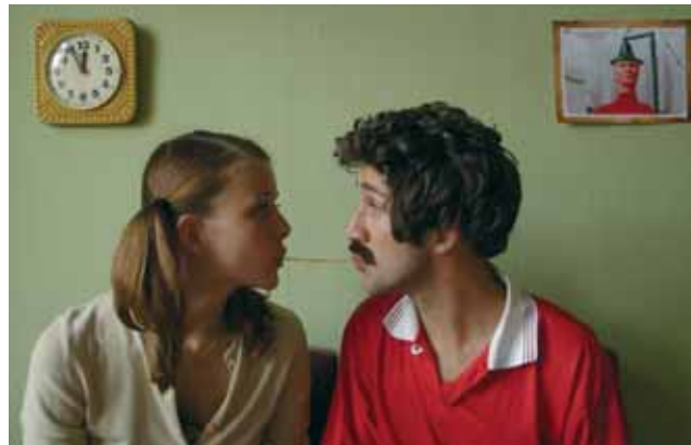
Der Bettnässer © Schiller-Müller