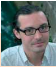
Arthur de Pins (FRA) Réalisateur Regisseur