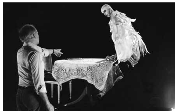
Tournage de Harpya