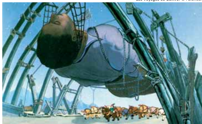
Les Voyages de Gulliver