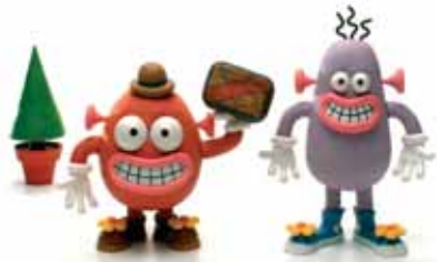
Show and Tell Peter's Room © Aardman