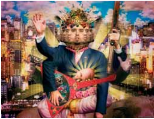
Lyapis Trubetskoy 'Capital'