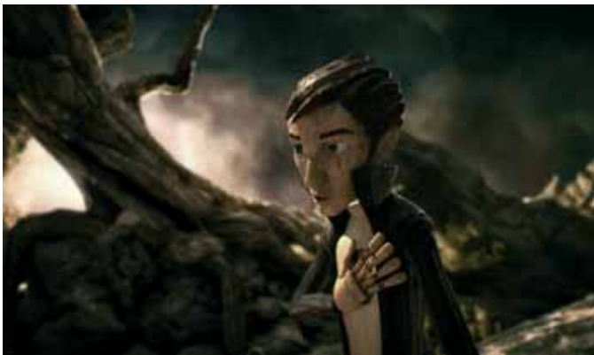
Dyonisos 'Tais-toi mon cœur'