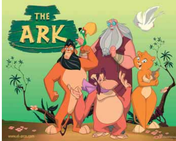
El Arca © Patagonik Animation Group sa, Filmexport Group