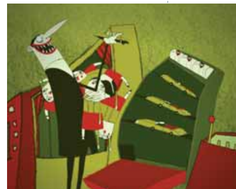
Pandora's box © KASK