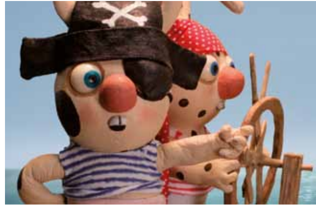
Gros-pois et Petit-point

En outre, les enfants de 5 à 12 ans pourront s'initier à la réalisation de petits films d'animation, avec l'atelier Zorobabel , présents tous les jours à Flagey de 13h30 à 16h00. Un stand de crêpes, installé dans le hall principal se chargera de rassasier les petites et grandes faims. De quoi passer de bonnes vacances, bien animées!