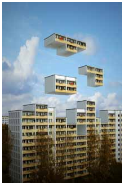
Berlin Block Tetris

Depuis toujours, Anima se penche sur la toile que tisse le film d'animation avec les autres média et formes d'expressions artistiques. Ainsi, Anima s'est intéressé de plus près aux liens qui unissent l'animation avec le Street Art d'une part, et avec les jeux vidéos d'autre part, proposant 2 programmes de courts métrages autour de ces deux thèmes.