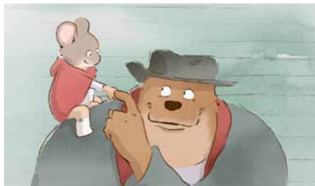
Ernest et Célestine

L'adaptation tant attendue des livres pour enfants de l'auteure belge Gabrielle Vincent. Benjamin Renner, réalisateur du film, Didier Brunner (Les Armateurs) et Vincent Tavier (La Partie), producteurs du film, et les animateurs et co-réalisateurs du film Vincent Patar et Stéphane Aubier, seront présents pour témoigner de cette grande aventure.