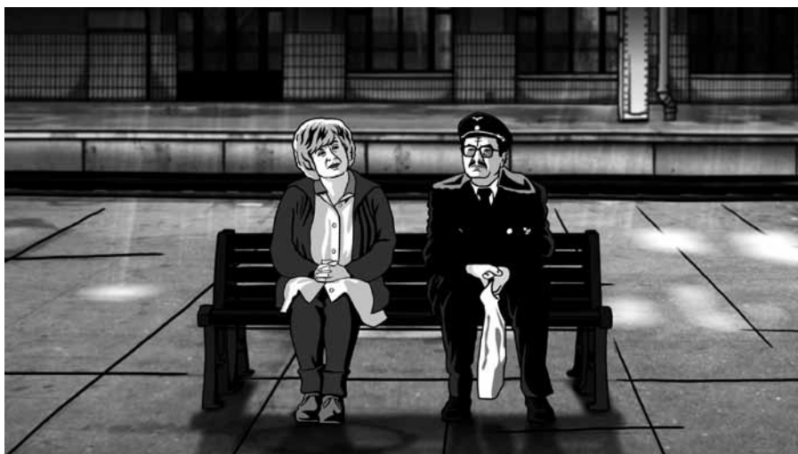
Alois Nebel © The Match Factory

Cette sélection souligne également le lien intime et persistant qui noue l'animation et la bande dessinée. En effet, quatre longs métrages de la sélection officielle (Arrugas, Alois Nebel, Tatsumi et George the Hedgehog) sont inspirés d'ouvrages à succès dans leur pays respectif.