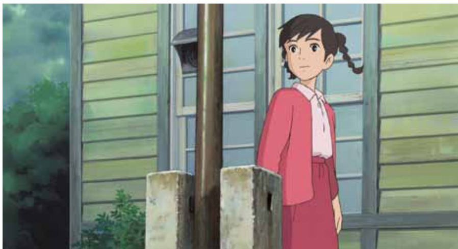
La Colline aux Coquelicots

Wij vinden het een eer om ANIMA 2012 te kunnen openen met de nieuwste film van de Ghibli Studio's : From up on Poppy Hill ( La Colline aux Coquelicots ) van Goro Miyazaki. De zoon van de Japanse grootmeester Hayao Miyazaki is met deze film niet aan zijn proefstuk toe : in 2006 maakte hij al de veelgeprezen Tales of the Earth Sea ( Gedo Senki ). Ditmaal vertelt hij ons het verhaal van Umi, een jonge lyceumstudente, die in een oud huis op de heuvels boven de haven van Yokohama woont. Elke ochtend sinds haar vader op zee verging, hijst zij twee seinvlaggen boven de baai, alsof zij een boodschap over zee wil sturen. Dat wekt de nieuwsgierigheid van Shun, een van haar medeleerlingen, een knappe jongen op wie Umi al lang een oogje heeft... Dat is dan meteen de kroon op wat bij ANIMA sinds 1992 een traditie werd: het van nabij volgen van het werk en de evolutie van de beroemde Ghibli Studio's.