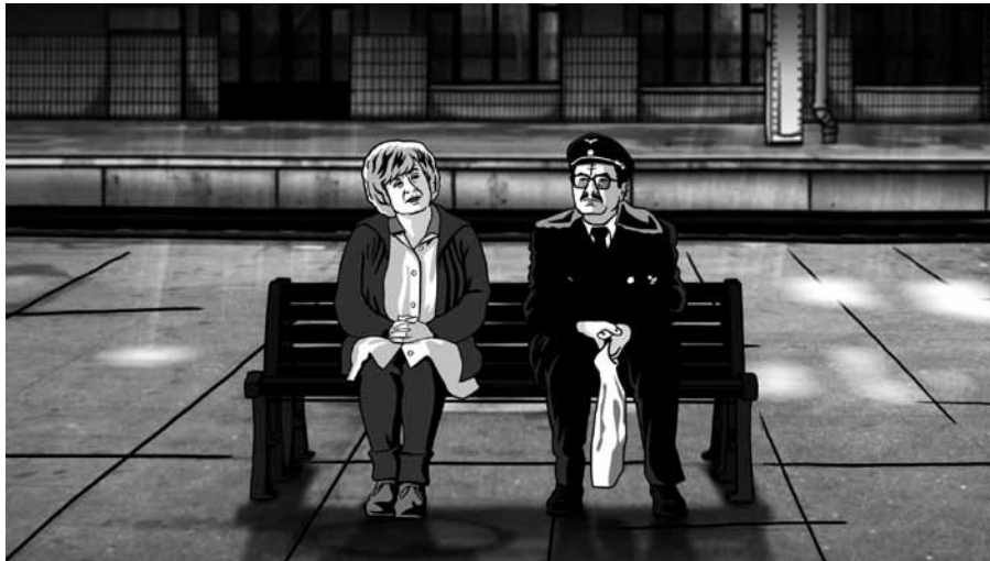
Alois Nebel

Deze selectie toont opnieuw de nauwe banden tussen de animatiefilm en de strip. Niet minder dan vier langspeelfilms in de officiële selectie – Arrugas , Aloïs Nebel , Tatsumi en George the Hedgehog – gaan terug op strips die in hun land van herkomst veel succes oogstten.