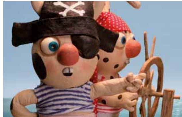
Gros-pois et Petit-point

Daarnaast kunnen kinderen van 5 tot 12 alle dagen tussen halftwee en vier zelf hun eerste stappen in de animatiefilm zetten met het Atelier Zorobabel . De kinderen kunnen hun kleine of grote honger ook stillen aan een pannekoekenkraam.