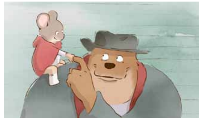
Ernest et Célestine