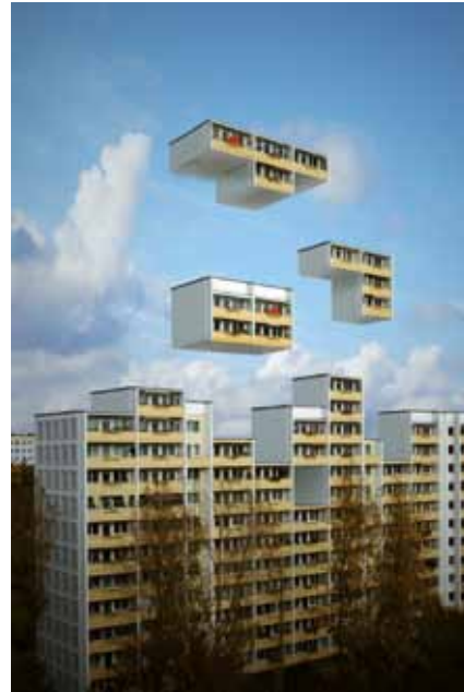
Berlin Block Tetris

Anima smeedt van oudsher de brug tussen animatiefilm en andere media en artistieke uitdrukkingvormen. Zo willen wij dit jaar met twee thematische kortfilmprogramma's eens kijken naar de connecties tussen animatie en "street art" en ook video games.