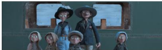
INTERDIT AUX CHIENS ET AUX ITALIENS Alain Ughetto, FR / IT / CH

Prix du Public du meilleur long métrage pour enfants