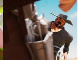
Wild West Compressed

Le festival a à nouveau réussi à brasser un public nombreux et varié de plus de 30.000 personnes à Bruxelles. Les décentralisations ont elles aussi fait leur plein de spectateurs. Dix jours riches en avant-premières avec de nombreuses séances se jouant à guichets fermés. Le jeune public était particulièrement au rendez-vous lors de l'avant-première de En Avant de Pixar/Disney et du long métrage franco-belge SamSam , des programmes de courts pour les petits L'Odyssée de Choum et Petit Poilu ; les adultes ont rempli les salles des séances d' Old Man Cartoon Movie et de Children of the Sea ; les professionnels et étudiants en animation étaient très nombreux à répondre à l'appel de la masterclass sur l'écriture de scénario de Theodore Ushev ou encore à la rétrospective de Hans Op De Beeck.