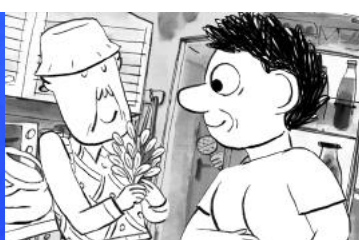
Saigon Sur Marne