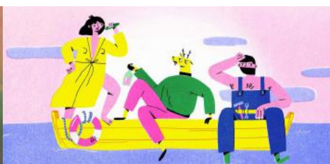
Sh_t Happens © BFILM