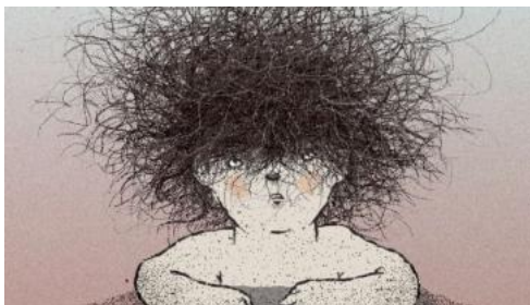
Purpleboy © Bando à Parte, Rainbox Productions

La 39 e édition d'ANIMA, le Festival International du Film d'Animation de Bruxelles, s'est clôturée ce dimanche soir dans le Studio 4 de Flagey.