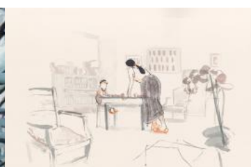
Tête de linotte !