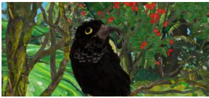
Songbird