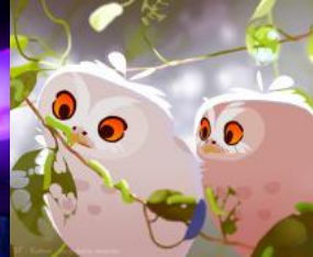
L'Odyssée de Choum © Le Parc Distribution - J.E.F.