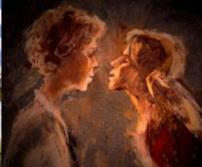
Physique de la tristesse © Office national du film du Canada