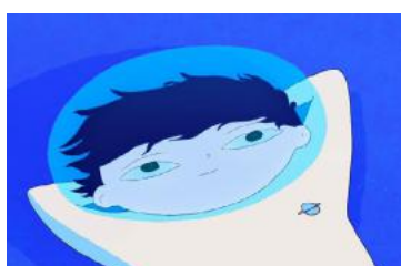
On est pas prêt d'être des supers héros