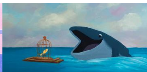
L'oiseau et la baleine