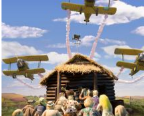
Old Man Cartoon Movie