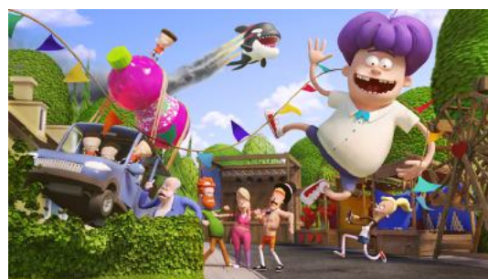
Monty and the Street Party

Het festival eindigt daarna in schoonheid met de officiële slotavond : het kruim van de animatiefilm, onder wie onze internationale gasten, komt dan in spanning luisteren naar het verdict van de diverse jury's en het publiek. De prijzencereemonie wordt vervolgens afgerond met de avant-première van de knotsgekke Deense film Monty and the Street Party van Anders Morgenthaler en Mikael Wulff, het orgelpunt van deze 39e editie van ANIMA, het internationaal festival van de animatiefilm van Brussel. Vanaf 22u volgt in Studio 5 dan nog een voorstelling met de bekroonde films .